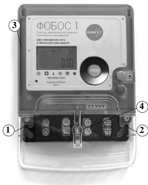
а) счетчик ФОБОС 1 в обычном корпусе

Общий вид и схемы пломбировки счетчиков показаны на рисунке 1.