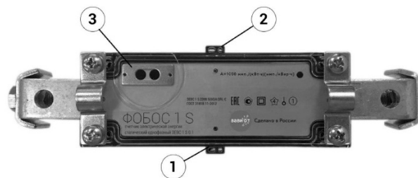
б) счетчик ФОБОС 1 модификации S без экрана