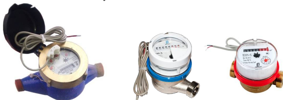
Рисунок 2 - Общий вид счетчиков с герконовым датчиком