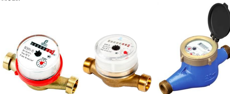
Рисунок 1 - Общий вид счетчиков

Схемы пломбировки счетчиков показаны на рисунке 4. Кольцо (при его наличии) выполняет роль пломбы.