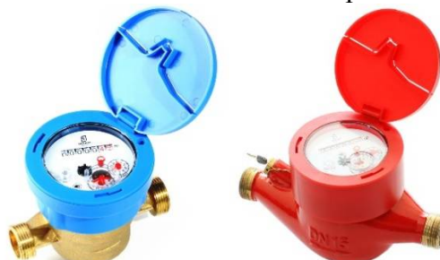
Рисунок 3 - Общий вид счетчиков МИД